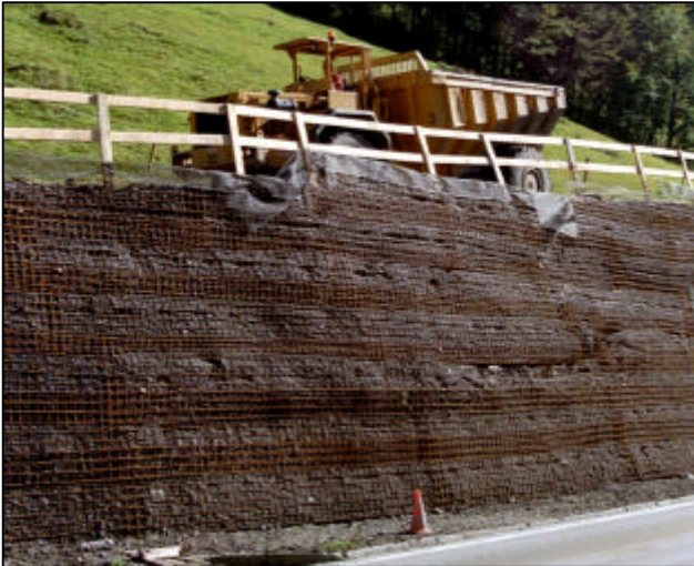
Abbildung 3.1-1: Sicherung der Oberfläche mit abgewinkelten Böschungsnetzen aus Stahl

sich somit an die unterschiedlichsten Anforderungen anpassen lässt. Gängige Methoden sind bei einer Böschung mit einer zu begrünenden Oberfläche neben speziellen Systemlösungen, verschiedene Möglichkeiten, die den Anforderungen auf der Baustelle angepasst werden können, wie die Umschlagtechnik, die auch mit sogenannten Böschungsnetzen, als verlorene Schalung ausgeführt werden kann oder das Einlegen von Bewehrungsgeokunststoffen nur bis in den vorderen Zwickel eines abgewinkelten Böschungsnetzes aus Stahl.