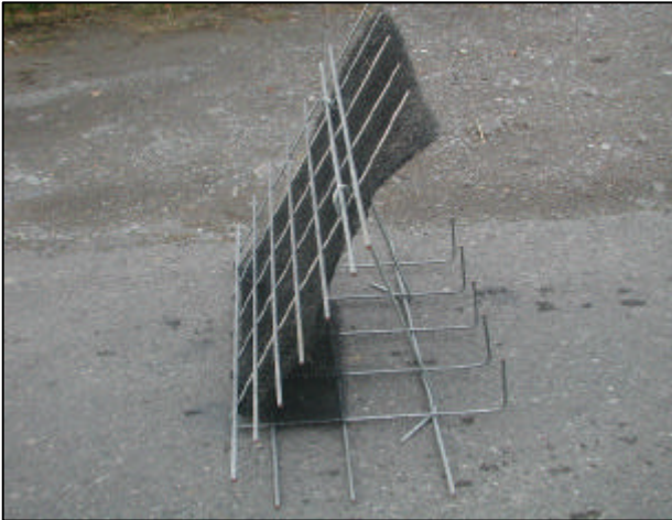
Abbildung 5-1: Rieselerschutz und Trägermaterial für die Anspritzbegrünung hinter einem Böschungsgitter

Neben den allgemein üblichen Hinweisen für das Verlegen von Geokunststoffen können je nach geplanter Außenhaut und Geometrie der Konstruktion weitere Arbeitsschritte hinzukommen. Auf der einen Seite sind zusätzliche Arbeitsschritte erforderlich wie das Errichten eines Fundamentes für Betonsteine, wenn die Tragfähigkeit des Untergrundes nicht ausreichend ist. Auf der anderen Seite können die Elemente der Außenhaut die Funktion einer Schalung mit übernehmen, so dass keine temporären Schalungen erforderlich sind. Dies ist z.B. bei den Böschungsnetzen aus Stahl der Fall.