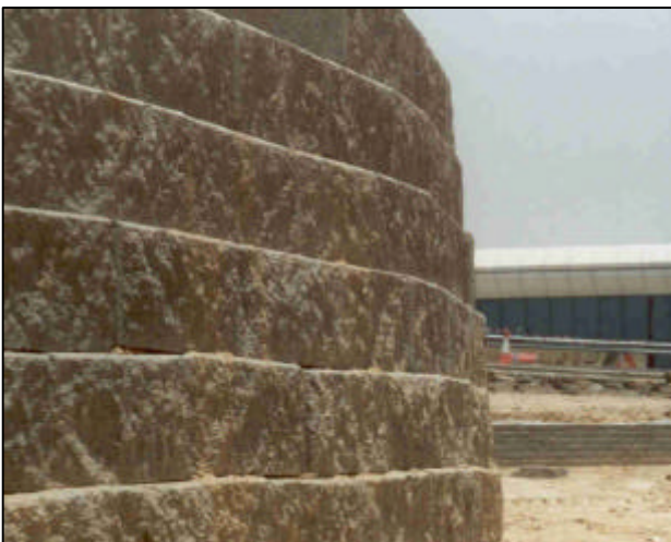
Abbildung 3.2-1: Rückverhängte Fassade aus Betonsteinen

Die Verbindung zwischen starren Außenhautelementen und Bewehrungsgeokunststoffen kann auf unterschiedliche Weise erfolgen. Die Varianten reichen vom bloßen Verlegen der Geokunststoffe zwischen Betonsteinen oder Gabionen bis hin zum Einbetonieren in Ortbetonelemente.