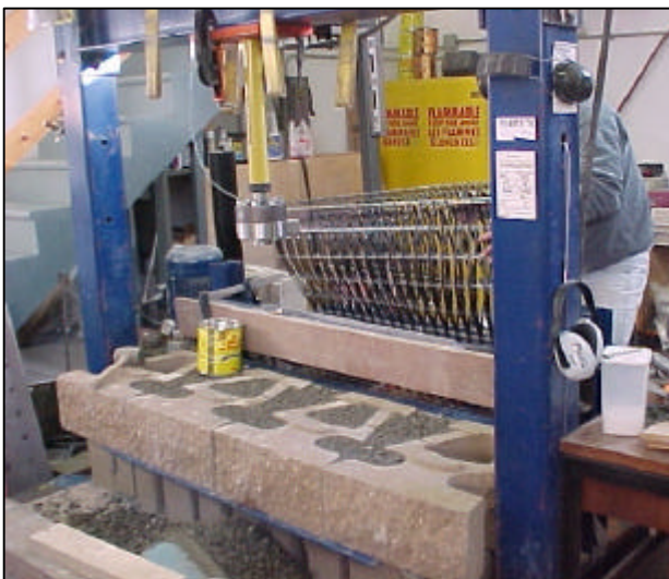
Abbildung 4.2-1: Versuchsaufbau zur Ermittlung des Verbundverhaltens Geokunststoff - Betonstein

Für die Verbindungskraft zwischen starren Außenhautelementen aus Beton oder mit Setzsteinen verfüllten Gabionenkörpern und geosynthetischen Bewehrungen sind ebenfalls großmaßstäbliche Versuche durchzuführen.